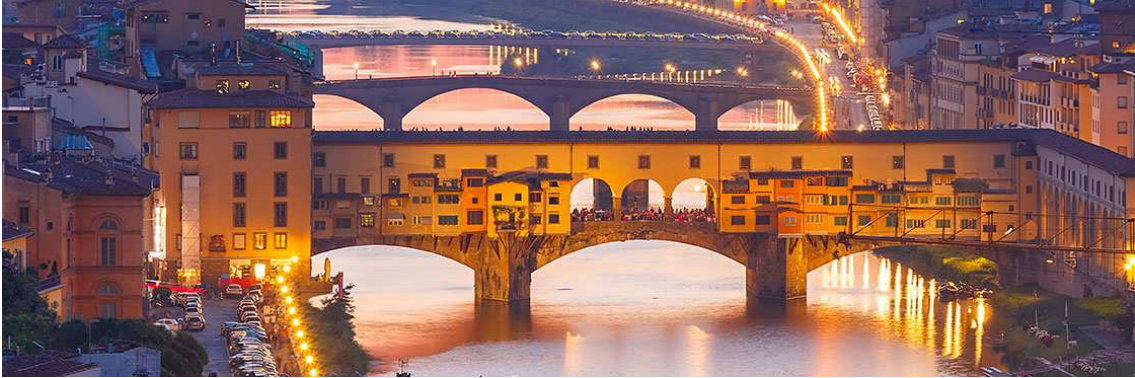
(imatge Ponte Vecchio , Florència)

- Pont habitat per sobre de la Diagonal de Barcelona sector universitari, tot connectant –per fi- els dos campus UPC :amb quin llenguatge?