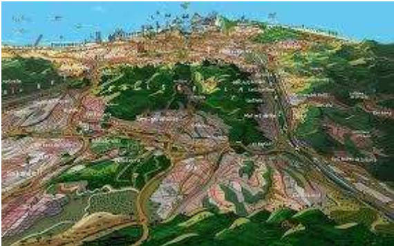
(imatge dibuix Mariscal)

Es tracta de relacionar entorn perifèric amb equipament cultural: perifèria física, centralitat intel·lectual