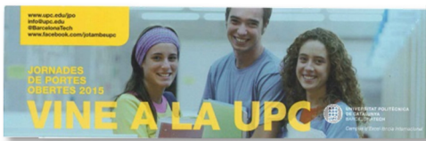
Punt de llibre de difusió de les JPO dels centres UPC

Durant aquest trimestre s'han dissenyat i elaborat els continguts de les diferents publicacions institucionals de promoció d'estudis: