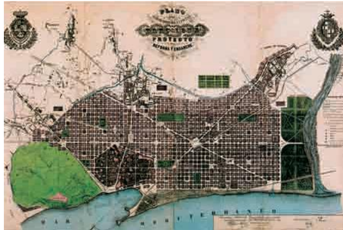
Mapa del projecte d'Eixample per a Barcelona d'Ildefons Cerdà, aprovat l'any 1859

La ciutat del segle XIX ens mostra com la industrialització entra plenament a la ciutat i es defineixen noves formes urbanes: nous tipus d'edificació (les estacions, els mercats, els restaurants, etc...), també s'emprenen noves accions urbanístiques: s'obren carrers, s'hi introdueixen nous serveis (gas, sanejament, ...). Podríem dir que es construeix la "ciutat d'ahir", imatges també compartides a través del cinema o de la literatura i que, a més, coexisteixen" d'alguna manera en la ciutat actual. Llavors és el moment del gran projecte de l'Eixample, dels desenvolupaments suburbans, de la demolició de la Ciutadella.