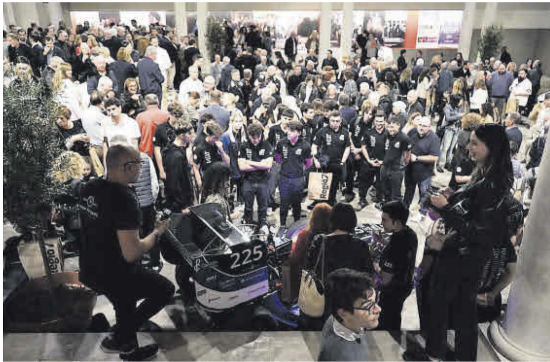
L'equip Dynamics UPC Manresa amb el seu vehicle de curses va ser una de les atraccions de l'acte