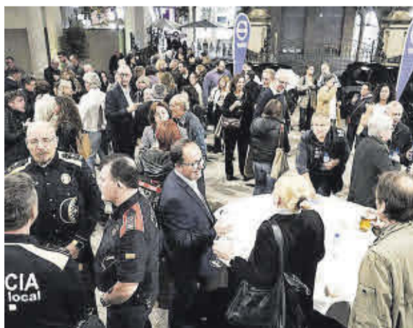
El pati del teatre Kursaal va quedar petit