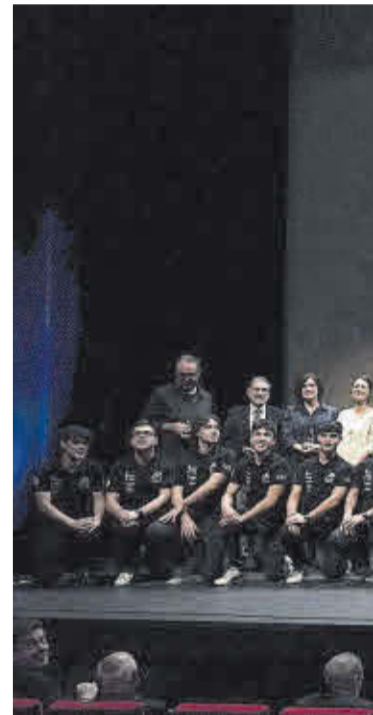
L'equip Dynamics UPC Manresa,