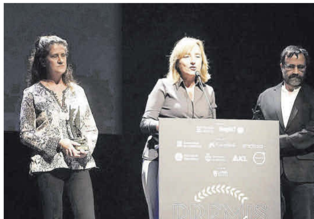
Els responsables de les escoles agràries de Manresa i de Solsona, premi Actius Socials